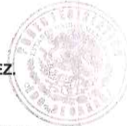
DIPUTADO JESÚS LÓPEZ RODRÍGUEZ.

EL CONGRESO DEL ESTADO DE OAXACA LXII LEGISLATURA DIP. JESÚS LÓPEZ RODRÍGUEZ DISTRITO XVI ASIGNACIÓN REGISTRO AN