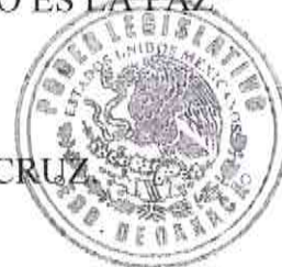
DIP. JUANITA ARCELIA CRUZ CRUZ

EL CONGRESO DEL ESTADO DE OAXACA LXII LEGISLATURA DIP. JUANITA ARCELIA CRUZ CRUZ DISTRITO XV HEROICA CIUDAD DE HUAJUAPÁN DE LEÓN