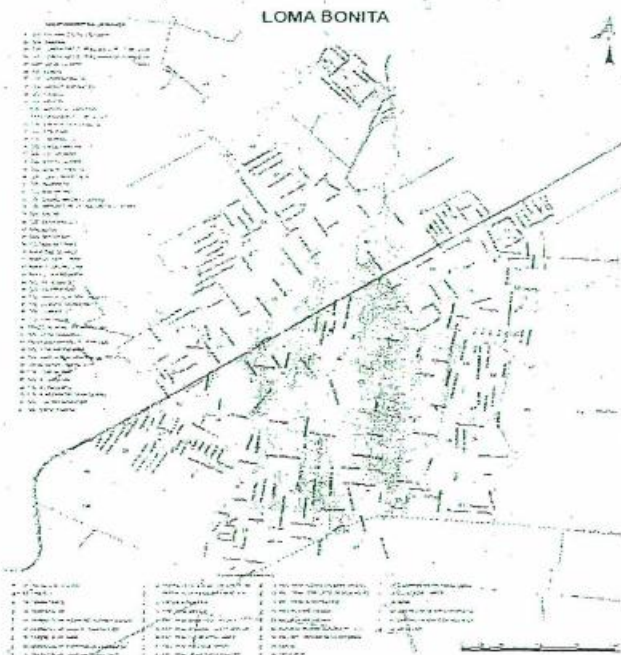
PLANO DE ZONIFICACIÓN

Artículo 45.- La tasa de este impuesto será del 0.5% anual sobre el valor catastral del inmueble.