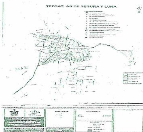
PLANO DE ZONIFICACIÓN CATASTRAL

Artículo 22.- La tasa de este impuesto será del 0.5% anual sobre el valor catastral del inmueble.