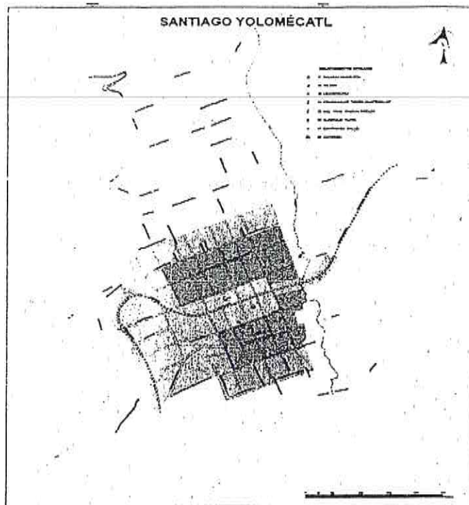
PLANO DE ZONIFICACIÓN CATASTRAL