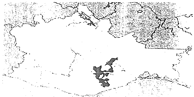
PLANO DE ZONIFICACIÓN CATASTRAL SAN CARLOS YAUTEPEC